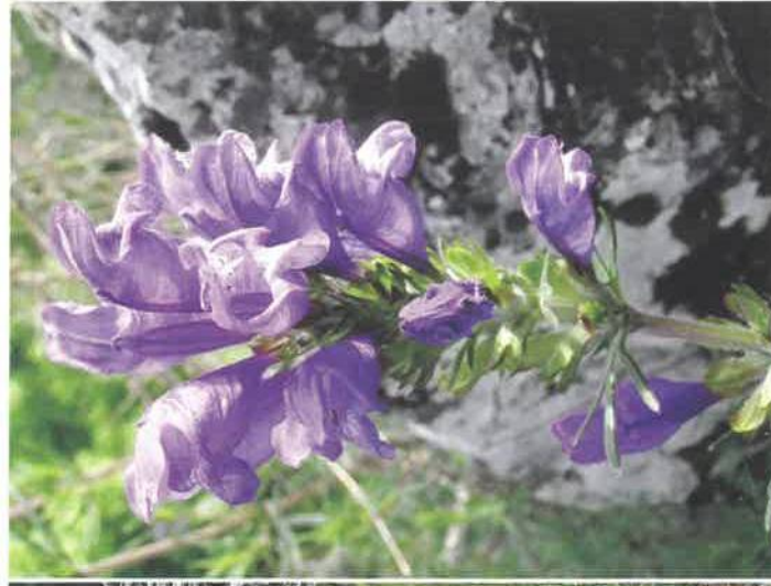
Včelník rakouský

Český kras je po všech stránkách neobyčejně pozoruhodný, protože má něco zcela specifického. Vápenci je to největší vápencová oblast v Čechách. Vápenec je usazená hornina vzniklá ve starších prvohorách z vápnitých schráněk mořských bezobratlých živočichů. Než se tato hornina utvořila do dnešní podoby, prošla velmi složitými geologickými procesy. Tím, že se vápenec rozpouští vodou, dochází ke krasování a k vytvoření unikátního prostředí s krasovými jevy – především jeskyněmi. Mezinárodní termín kras byl převzat z názvu stejnojmenné jihoevropské oblasti poblíž Terstu.