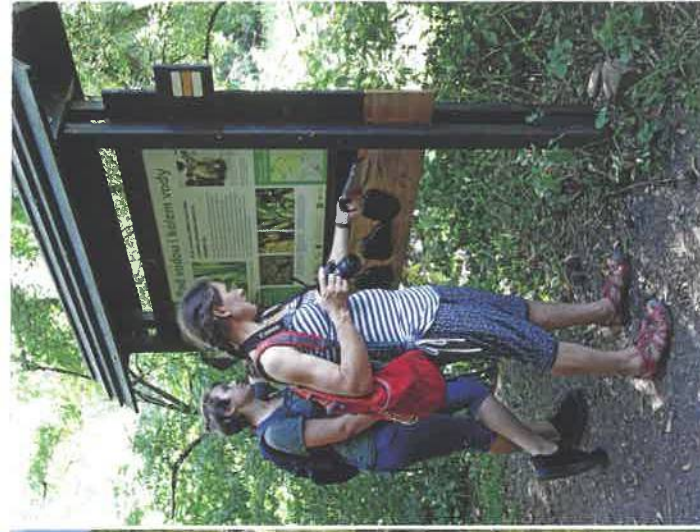
Stežka Srdcem Českého krasu

Krajina obnažených skal je pozůstatkem dob poledových, kdy sucho a mráz omezily růst dřevin. S příchodem lesa z teplejších jižních krajů přišlo i zemědělství, které části krajiny udržovalo bezlesé. Díky tomu mohlo přežít mnoho druhů rostlin a živočichů, které snesou horko a sucho, ale nikoliv zastínění spojeným lesem. Proto se snažíme na nejpennějších bývalých pastvinách obnovit pastvu ovcí a koz, která po tisíciletí krajinu vytvářela. Máme rádi i protiklad intenzivní péče, proto vymezujeme bezzáasahová území. Ta jsou vhodná především ve stinných lesnatých roklích, kde by těžba dřeva nebyla ani ekonomicky smysluplná. V bučinách a suťových lesích se hromadí mrtvé dřevo pro vzácné houby a hmyz.