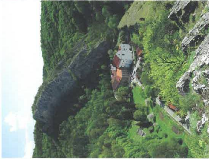
Svatý Jan p. Skalou

Český kras – krajina vápencových skal, rozvolněných světých lístnatých lesů, lesostepí a skalnatých stepí podél řeky Berounky mezi Prahou a Berounem. Největší krasové území v Čechách, které má počátky v prvohorním moři před 400 miliony lety.