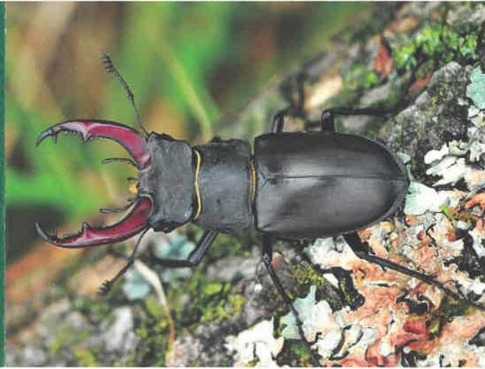
Roháč obecný

Typické rostliny skal nesou vlastnosti skalniček: dužnaté listy lomikamenu vždyživého musí fungovat jako zásobárna vody pro období sucha. Nejcennější rostlina - včelník rakouský, tuhými jehlicovitými listy podobný rozmarýnu, velkými fialovými květy zase šalvěji - roste velmi vzácně také na skalních ostrožnách. Z relativně snadno rozpustného vápence se tvoří velmi málo půdy, navíc vápencové skály plné puklin neudrží mnoho vody. I stromy se přizpůsobují horku a suchu – listy dubu pýřitého neboli šípáku se ochlupením brání ztrátě vody výparem, chlupaté jsou i po opadání. Statná tráva kavylívanůvými dlouhými péřnaté chlupatými osinami za květu připomíná vousy svatého Ivana. Kavylově trávníky podobající se rozvlhčenému moři upomínají na širé východoevropské a vnitroasijské stepi.